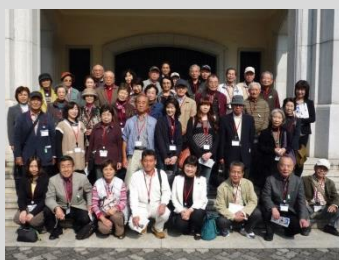
市ヶ谷記念館の前で

以上のとおり、内容の濃いツアーで、車中の意見交換により、県政・市政を考える良い機会となり、大変楽しく意義あるツアーに感謝します。