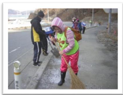
ボランティア活動での作業