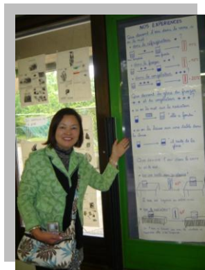
エコールマテルネルの教材の前で

今回、フランスの子育て支援の現場を視察して、こどもを大事にすること、社会でこどもを育てると意識の高さ、女性の労働力を必要とするため、必然的に子育て支援に力を入れてきた歴史などを知ることができました。日本も一日も早く、こどもへの投資を惜しまない国となるよう、積極的に提言していきます。