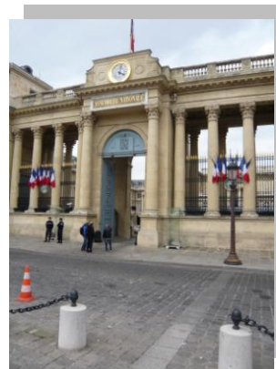
フランス国会下院

また、クニデフという、女性情報センターは、国からの補助金が98%、フランス全土114の地域の女性センター組織をネットワークしています。