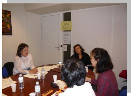
女性労働・社会関係省の方と

相談事業や国会への意見要望などが仕事です。相談では、万国共通の課題DVや離婚、自立、雇用、シングルマザーの問題などが多いそうです。女性たちの声が直接国に反映され、法律づくりに生かされており、素晴らしいと思いました。