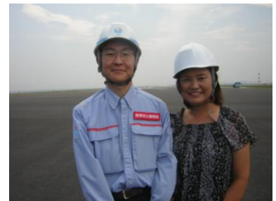
関東地方整備局の方と

成田空港は現在約100都市に就航し、発着枠が不足しており、地の利が遠いことや、発着時間制限があるため、羽田との共存共栄ができることになります。これまで、成田は国際線、羽田