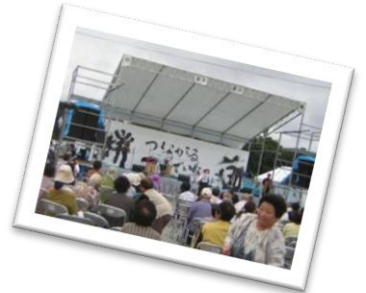
仮設住宅でのお祭り

これからの被災地への支援は、商店や事業再生など生活復興に重点が置かれています。被災された方々に寄り添い、安全安心な暮らしが取り戻せるよう祈りながら帰途に着きました。