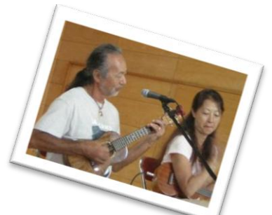
ハーブムーンのウクレレ演奏