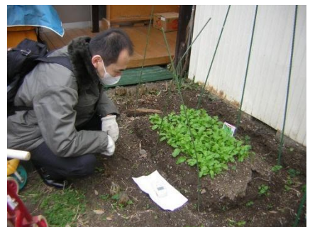
おひさま保育舎での放射能測定調査

こどもを持つ親にとって、正しい情報を知ることは重要で、これからも引き続き、情報公開を行い、市民に安心感を与えてほしいと思います。