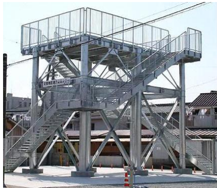
津波タワーのイメージ=和歌山県田辺市の事例

県は、東日本大震災を受けて、最悪の事態に備えることを目的に、昨年 11 月「津波浸水予想図」を発表しました。対象地震と対象津波については 12 の地震、明応型(1498 年)慶長型(1605 年)元禄型などから予測。慶長型では、鎌倉に 14.4m、元禄型では真鶴に 8.8m という結果です。地震からわずか 10 分で最大波が到達する恐れもあり、命を守るには、5 分以内に避難するしかないといえます。