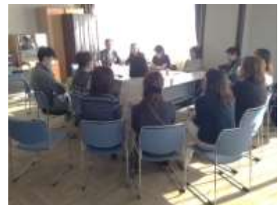
神奈川県子宮頸がんワクチン被害者の会との交流会

県内には副反応報告が25人、茅ヶ崎市では4件となっており、「神奈川県子宮頸がんワクチン被害者連絡会」が設立されました。連絡会からは、国に接種事業の中止、治療法の確立、治療への金銭的援助を求め、さらに被害生徒への学習支援や相談、学校での配慮なども要望しています。