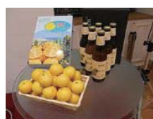
湘南ゴールドとビール

ゼリーやラスクなどの加工品も出ており、そこうや高島屋などのデパートにもある。食べ頃が短く、傷みやすいのが難点。今後加工品を含め、販売促進策に力を入れて欲しい。