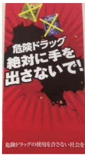
県のパンフレット