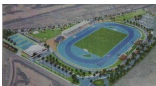
柳島スポーツ公園イメージ図

柳島の農振地域にいよいよスポーツ公園ができます。公式用総合競技場、スタジアム、テニスコート、ジョギングコース、レストラン、スタジアムなどが併設。市初めのPFI方式で74億8758万円の事業費です。競技場は、サッカー・ラグビー・ゴルフ・フットサルなど全天候型で一般から誰でも利用できます。また、この公園は広域避難地帯になっており、クラブハウスやメインスタンドは避難施設となっています。