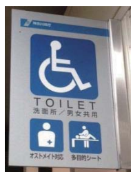
県庁 オストメイト対応 1か所のみ

条例」があります。オストメイトに対する正しい知識や理解を促進していくよう強く要望しました。