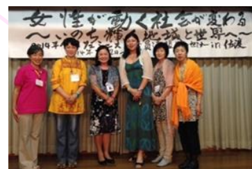
全国フェミニスト議員連盟サマーセミナー

ワークライフバランスの推進 イクメンを支援 あらゆる政策決定の場に女性を 若者に安定雇用を 労働者派遣法の改悪に反対 ブラック企業対策の強化