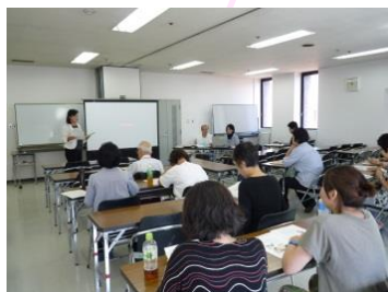
認知症サポーター講座