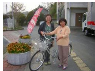
福島へ自転車3台搬

すべての暴力・ハラスメントの根絶 認知症の人たちを地域で支える仕組みづくり 障がい者が地域で自立して働けるよう就労支援