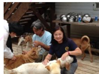
犬の保護シェルター「KDP」