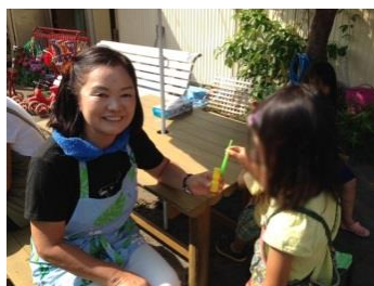
おひさま保育舎で保育